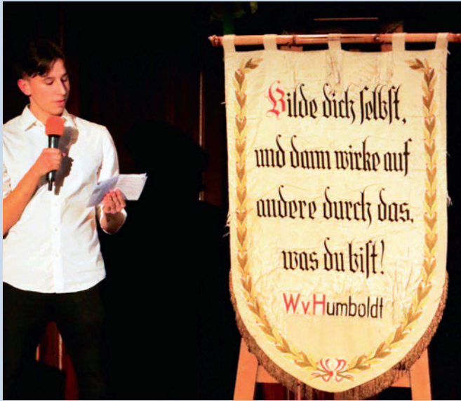
Wilhelm von Humboldt 1767-1835

Ausgehend vom Humboldt'schen Erziehungsgedanken vermitteln wir am Humboldt-Gymnasium eine umfassende Bildung und haben es uns zur Aufgabe gemacht, die Schülerinnen und Schüler zu befähigen, ihr Leistungspotenzial auszuschöpfen. Es ist unser Ziel, Interessen und Begabungen frühzeitig zu erkennen und nachhaltig zu fördern. In einem Klima gegen-